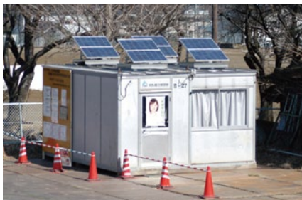
工事現場仮設事務所の屋根に設置した事例

工事現場の事務所などの仮設建築物、イベント、発電量実証試験等に最適です。機器のみをレンタルするだけでなく、システム一式として取付検討、設置から撤去までトータルにサポート致します。規模や設置期間、様々な用途に応じてアレンジが可能ですので、お気軽にご相談ください。