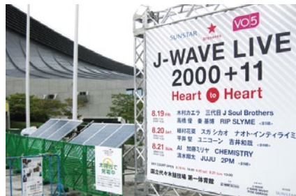
ライブイベントの照明等の電源に利用した事例