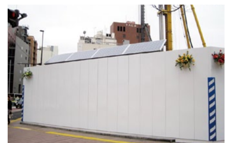
工事現場仮囲いの上部に設置した事例

●お問合せは / TEL 0265-98-0834 メール info@rentasolar.jp