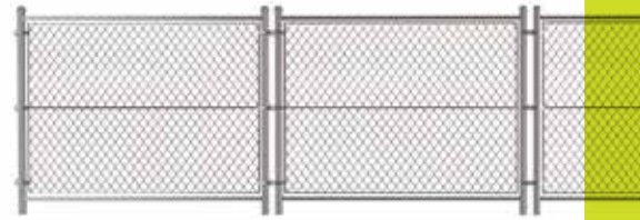
Panel Fence for Solar power Plants